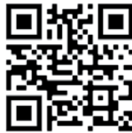
Através do QR Code acima, acesse o filme 'Scenes from the Suburbs' legendado em português

Cantando sobre a efemeridade da vida com a pandemia em mente, os versos "tire seus pés do asfalto quente e os coloque na grama / porque já passou" batem ainda mais forte. Os muros construídos na década de 1980 já começam a cair, nossas florestas ficam nuas e nossos prédios mais altos, séculos se passaram desde a escravidão e ainda vivemos numa sociedade extremamente racista. "Então, você consegue entender / Por que eu quero uma filha enquanto ainda sou jovem? / Eu quero segurar a mão dela / E lhe mostrar um pouco de beleza / Antes que todo o dano seja feito". Hoje penso melhor se já não estamos presenciando o dano completo diante dos nossos olhos.