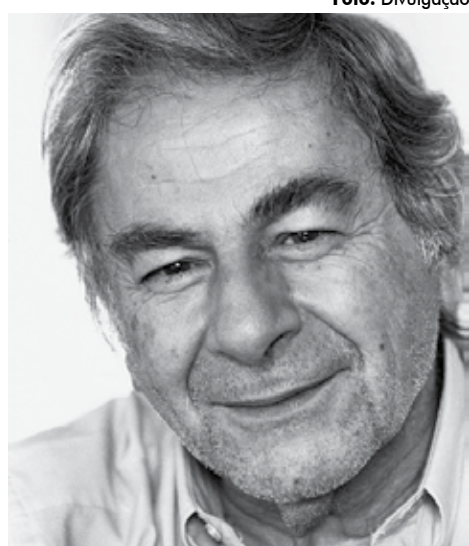
Escritor paulista é dono de uma narrativa barroca

O domínio narrativo de Nassar, a atualidade de seus temas e o fascínio exercido por sua verve literária situam-no entre os grandes nomes da literatura contemporânea, a despeito de sua reiterada aversão aos circuitos intelectuais e de seu esforço em rasurar suas influências. Em 1996, o Instituto Moreira Salles dedicou o segundo número dos Cadernos de