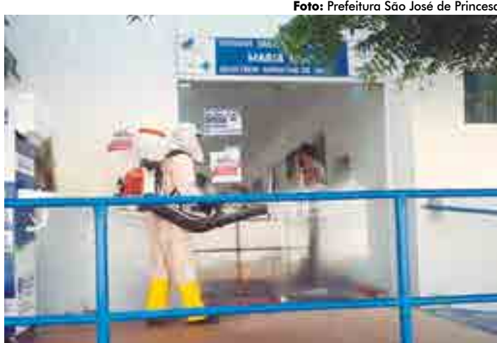
Município de São José de Princesa registrou primeiro caso na última semana

Depois de João Pessoa e Campina Grande, que lideram a lista no Estado com 13.298 e 6.625 casos confirmados da covid-19, aparecem Guarabira (2.214), Cabedelo (1.829), Patos (1.437), Santa Rita (1.879), Mamanguape (1.191), Pedras de Fogo (950), Bayeux (922) e Caaporã (747). Já em proporcionalidade as cidades com maior índice de contaminação, casos por mil habitantes, são: Guarabira, Caaporã, Mamanguape, Campina Grande, João Pessoa, Patos, Santa Rita e Bayeux.