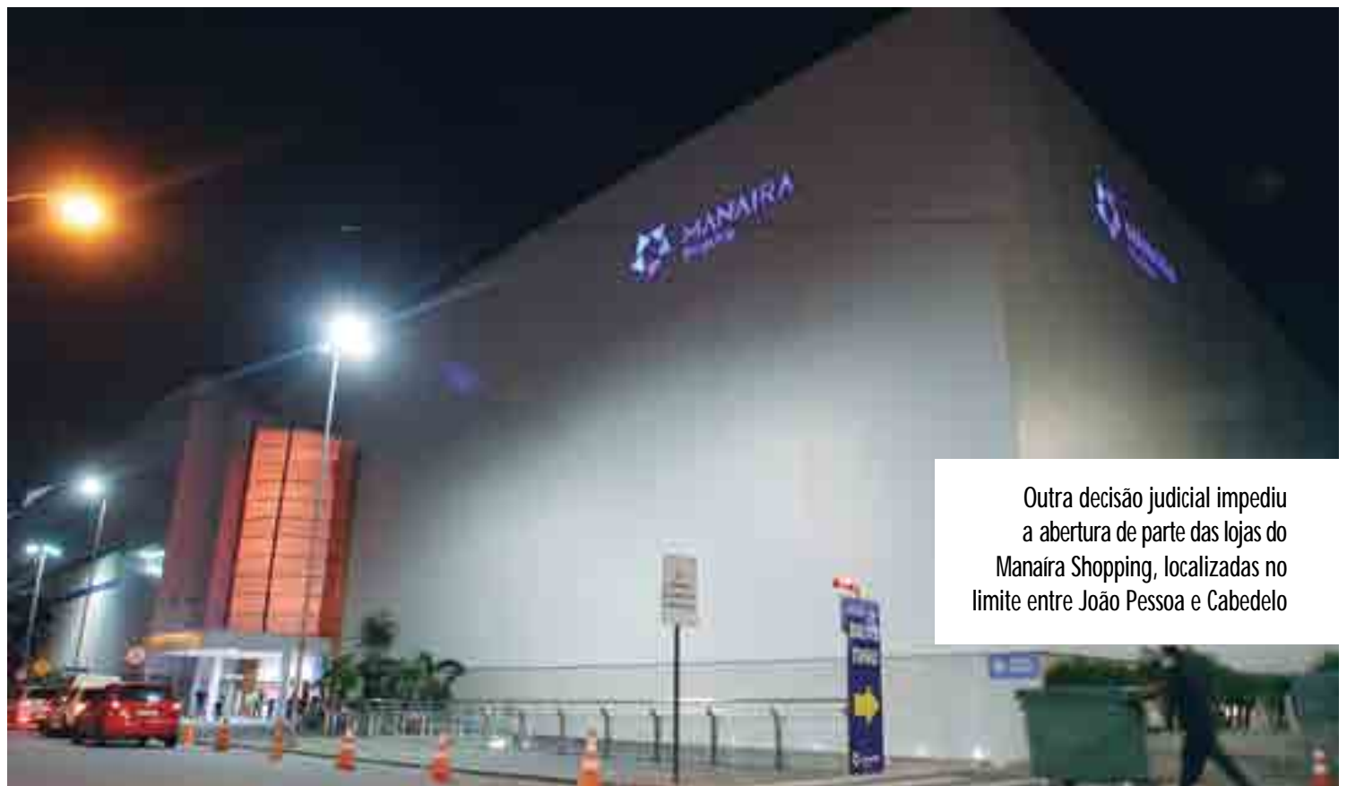
Outra decisão judicial impediu a abertura de parte das lojas do Manaira Shopping, localizadas no limite entre João Pessoa e Cabedelo

Em nota divulgada ontem, a administração do Manaira Shopping afirmou que tem, juntamente aos seus lojistas, o compromisso de cumprir todas as recomendações das autoridades e, por isso, seguirão integralmente a decisão da Justiça. A reabertura dos estabelecimentos estava marcada para hoje. As atividades no shopping continuam funcionando apenas em sistema de delivery e/ou drive-thru.