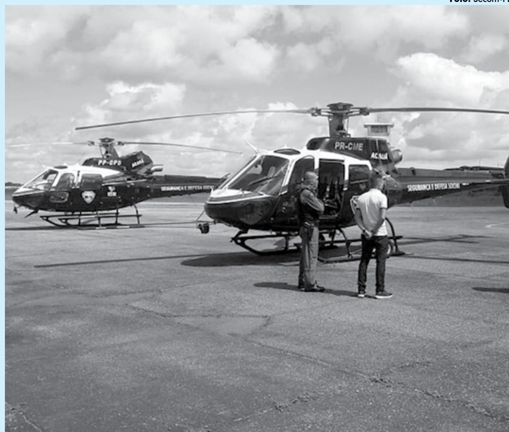
Forças de segurança têm usado os helicópteros em várias ações e a ideia é ampliar o apoio aéreo