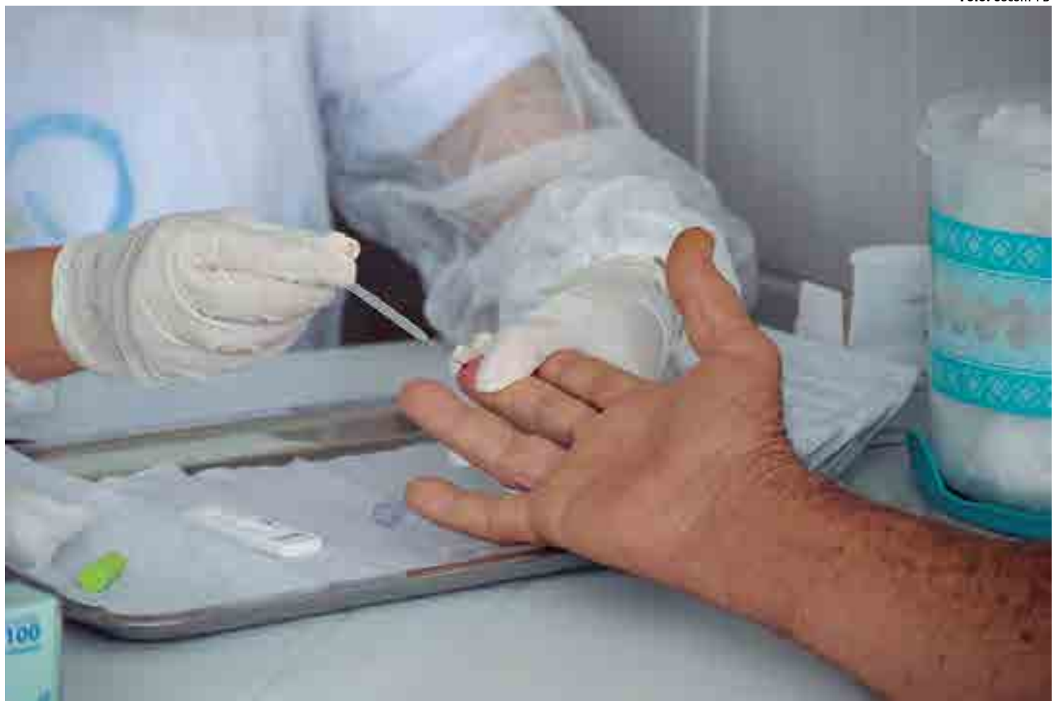
Já foram aplicados 129.254 testes para a detecção de pessoas infectadas pelo coronavírus na Paraíba; Estado já descartou 43.070 casos da doença

Os casos confirmados estão distribuídos por 218 dos 223 municípios paraibanos, sendo João Pessoa (13.298); Campina Grande (6.625); Guarabira (2.214); Cabedelo (1.829); Patos (1.437); Santa Rita (1.279); Mamanguape (1.191); Pedras de Fogo (950); Bayeux (922); Cajazeiras (524); Sousa (513); Queimadas (483); Pitimbu (471); Sapé (465); Alagoa Grande (434); Alagoinha (420); Rio Tinto (411); Conde (374); Lagoa Seca (354) e Alhandra (313) aqueles que possuem o maior número de infectados pela covid-19.